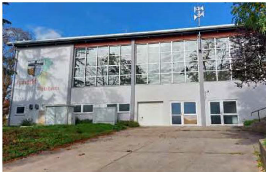
Die Eintrachthalle in Mölsheim wurde vor genau 60 Jahren errichtet. Jetzt muss sie dringend generalsaniert werden. Dabei könnte das regionale Zukunftsprogramm des Landes helfen.

Die Verbandsgemeinde Monsheim gehört mit einem vorläufigen Förderbudget von 1,7 Mio. Euro als einzige Gebietskörperschaft in Rheinhessen zum Kreis der Antragsberechtigten. Dies ist insbeson-